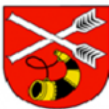
GMINA KOMARÓWKA PODLASKA