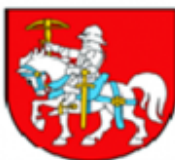
GMINA ŚLASK MALGORZAT